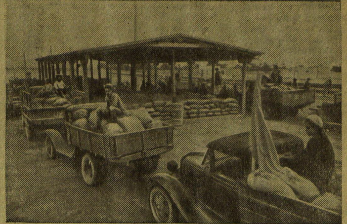
ТУРКМЕНСКАЯ ССР. Непрерывным потоком идет хлеб нового урожая на государственные пункты. Более 20 колхозов Геок-Тепинского района приняли участие в организации крупного каравана с зерном. На снимке: колонна автомашин с зерном нового урожая на заготовительном пункте.

Колхозы Нагутского района отстают с вывозом обмолоченного зерна на элеваторы. И в этом есть доля вины нашего города. Ни одна машина не должна простаивать из-за технических поломок.